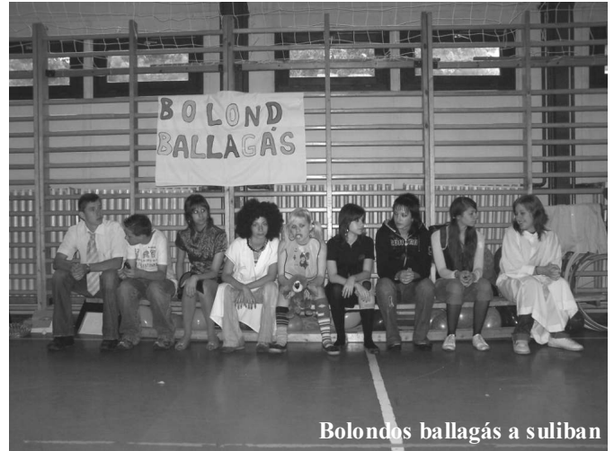
Bolondos ballagás a suliban