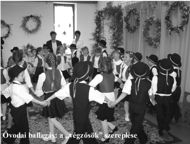
Óvodai ballagás: a „végzősök” szereplése