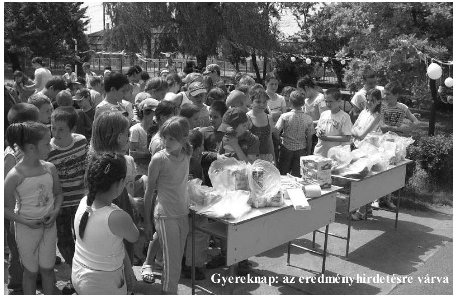
Gyereknap: az eredményhirdetésre várva