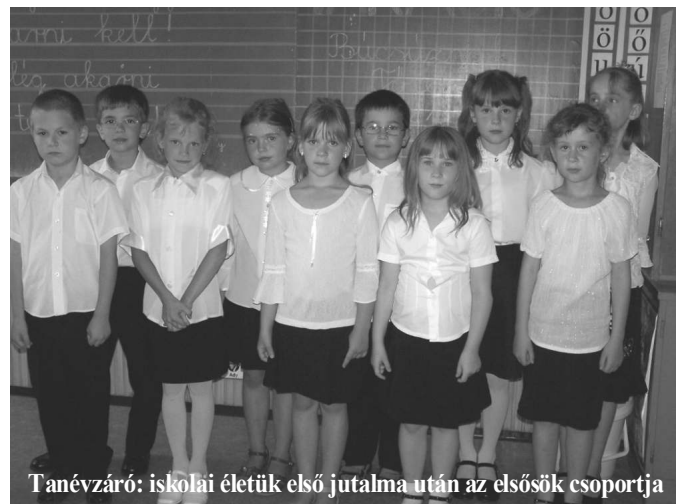
Tanérváró: iskolai életük első jutalma után az elsősök csoportja