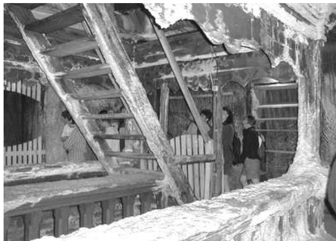
A tordai sóbánya