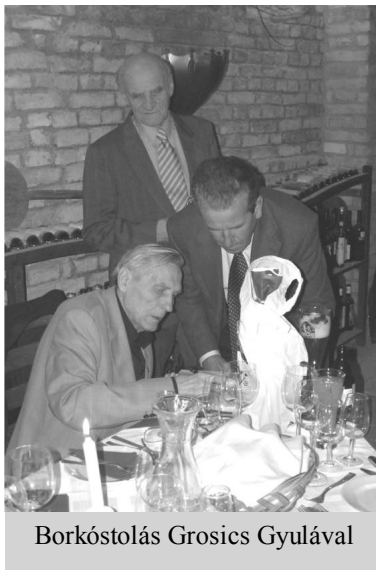
Borkóstolás Grosics Gyulával

Az első – számomra felejthetetlen élmény - , ami dr. Konkoly Mihály nevéhez fűződik, 1973-ban történt. Országos pártfeladat volt a kistelepülések összehívása. Jászboldogházának is dönteni kellett: megtartja önállóságát, vagy egyesül a szomszédos Jánoshidával. Misi bácsi, mint képviselő, nagyon határozott, szívhez szóló érvekkel győzött meg bennünket, hogy az eddigi eredmények alapján maradjunk az önállóság mellett. Az Ő kezdeményezése alapján – bár ez nem felelt meg a „felső” elvárásoknak – folytathatta községünk az 1946-ban önállóan elkezdett építőmunkát.