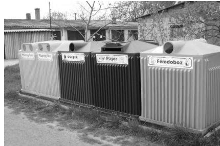
Négyfrakciós szelektív gyűjtő.

Legfőbb feladatát az illegális hulladéklerakó helyek felszámolását és a település közterületén lévő parkok