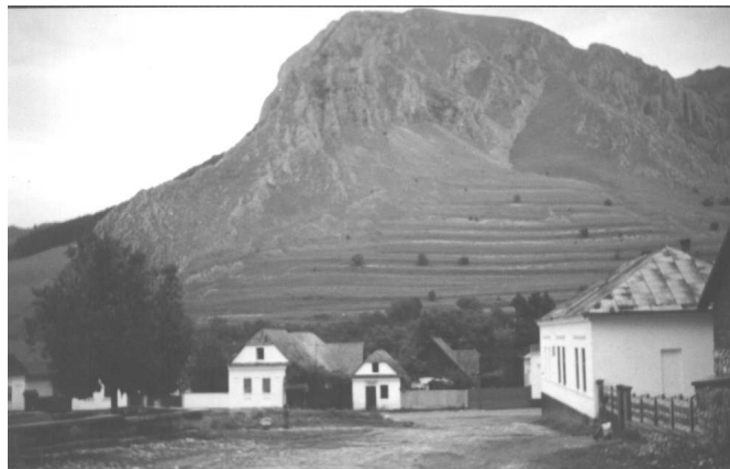
Torockó és a Székelykő