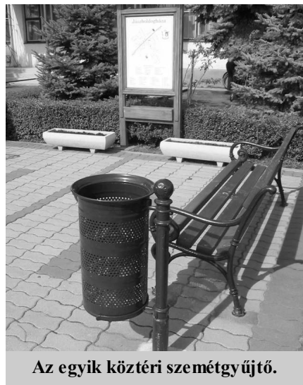
Az egyik közterületi szemétközet.

gondozását a program végéig, 2008. július 30-ig látja el.