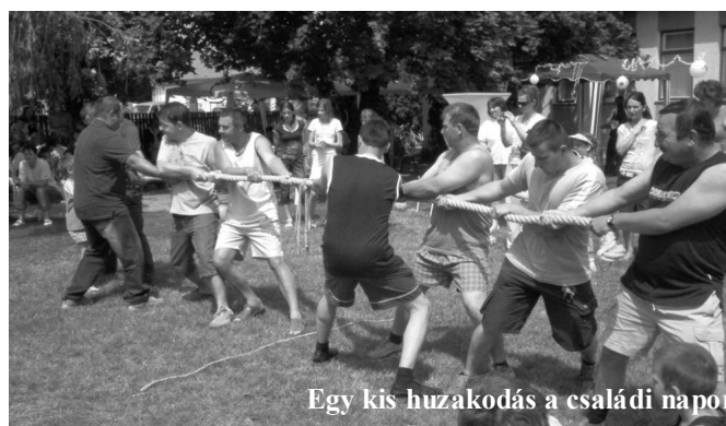
Egy kis huzakodás a családi napon