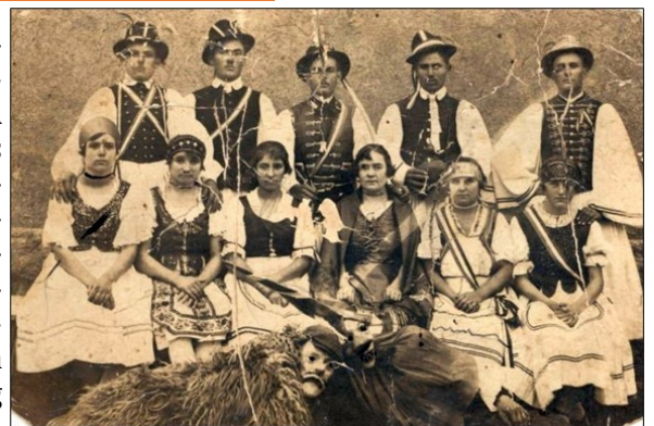
Szüreti bálón az Üveges vendéglőben

A vallásgyakorlás természetes része volt a boldogházi emberek életének. A tápiói kis kápolna fontos lehetőséget, egyben jó példát is jelentett erre. 1927-ben a csíkosi lakosok összefogásával ezen a határrészen is megépült a kápolna. 1930-ban pedig a későbbi község központjában közadakozásból felépült a katolikus templom.