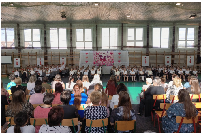
Anyák napja az iskolában