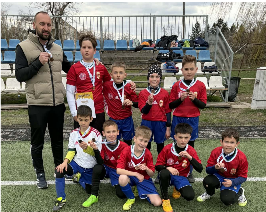
Diákolimpia megyei elődöntő

II. korcsoportos csapatunk a jászberényi selejtezőből továbbjutva a megye legjobb csapatai közé került. A csoportunkban a második helyen végeztünk.