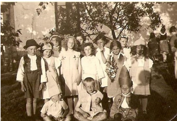
Tápiói színjátszó iskolások

A templomi búcsúk elsősorban vallási események voltak, de nagyon fontos szerepet játszottak a család, a rokonság összetartásában, a közösségformálásban is.