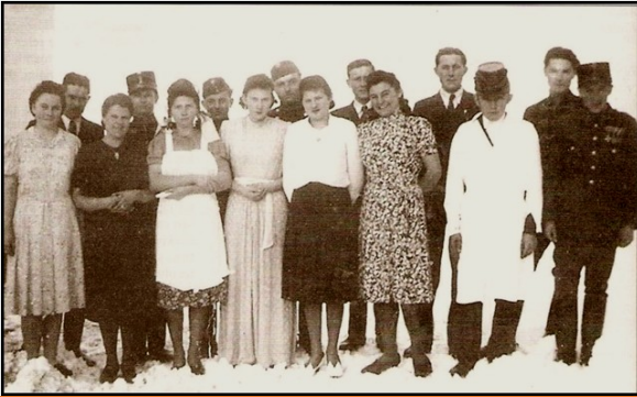
Sóshidai színdarab szereplői

fontos fórumai lettek azoknak a beszélgetéseknek, terveknek, melyekben egyre határozottabban fogalmazódott meg a Jászberénytől való elválás, az önálló községgé alakulás gondolata. A közösen elért eredmények nyomán az emberek már érezték az összefogásban rejlő