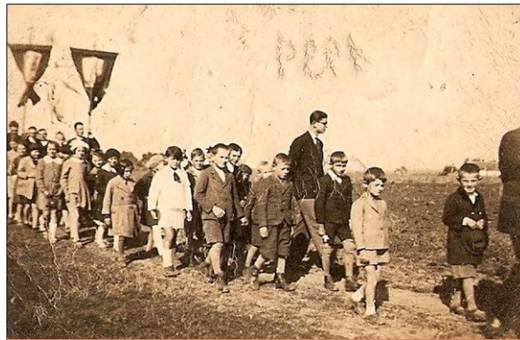
Csíkosi búcsú körmenettel

zásból felépült Boldogháza első iskolája a tápiói határban, ami egyben imaház is volt, később kápolnává alakították. 1896-ban Alsóboldogházán katolikus iskola létesült, és néhány év múlva állami támogatással a belterületi, csíkosi és sóshidai határrészen is iskolák épültek. Az 1910-es évektől a tanyavilágban élő gyermekeket öt kis iskola várta, ahol a tanításon túl nagy sikerű színi előadásokat, és jó hangulatú bállokat is tartottak.