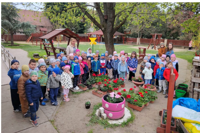
Egy gyermek — egy virág az oviban