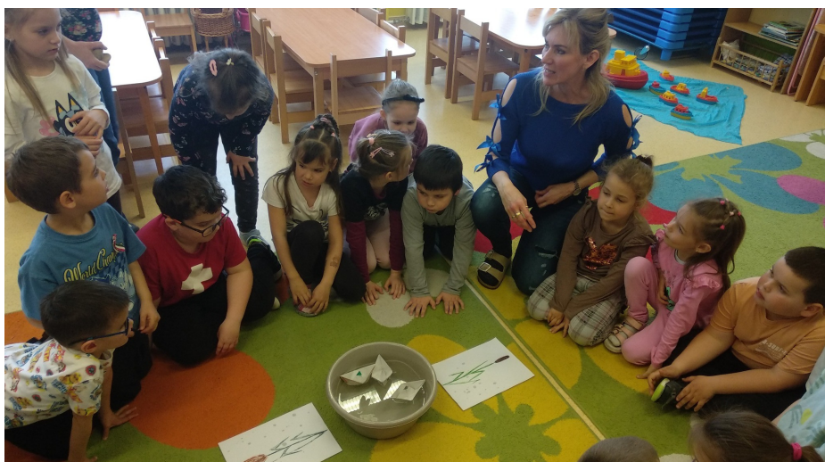
A víz világnapján