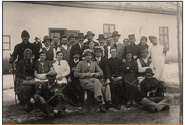
A falu gyöngye - színjátszók az alsóboldogházi gazdakörben