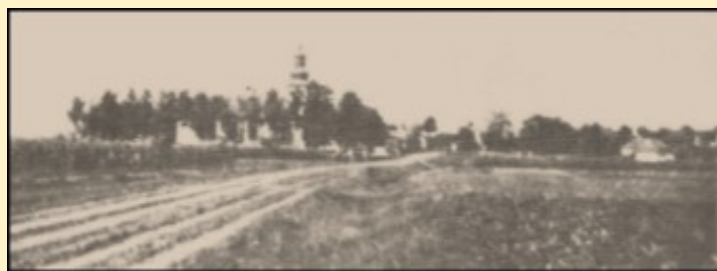
A Rákóczi utca régen és ma