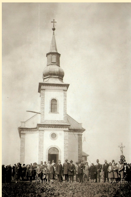
A katolikus templom