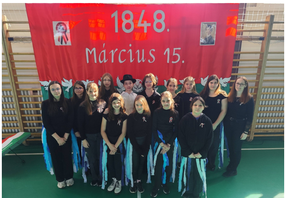
Március 15-i megemlékezés

Jánoshidán a Petőfi Sándor Általános Iskolában rendezték meg a 32.