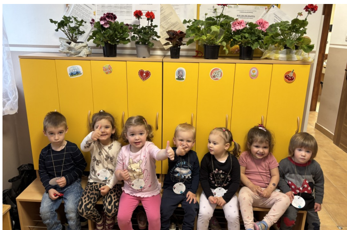
Föld napja a bölcsiben