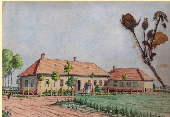
A központi iskola - Soós István akvarellje