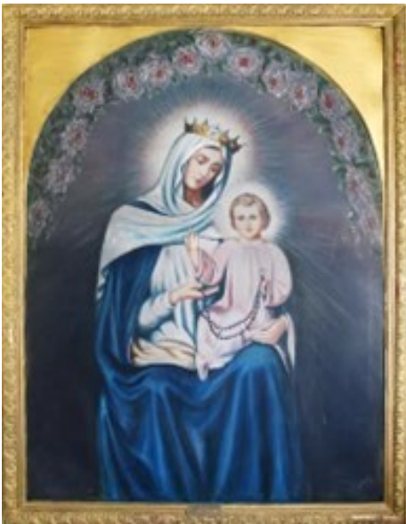
A csíkosi kápolna oltárképe

A boldogházi tanyavilág népessége folyamatosan gyarapodott, és kezdte megszervezni önmagát. A tanyák között lévő távolság nem jelentett elszigeteltséget, elzárkózást. A közösen végzett gazdasági munkák, az esti szomszédolások, a nagy disznótorok, a népes búcsúk fontos és emlékezetes eseményei voltak az itt élőknek.