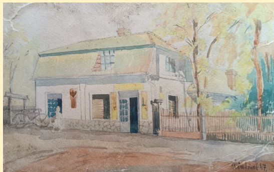
Az Üveges vendéglő Kiss József tanár rajza

A későbbi község központja sokáig tanyavilág volt. Első utcája a mai Petőfi utca volt, melynek egységes külsejű házait vasutasok számára építették az 1900-as évek elején. Néhány ház ma is őrzi eredeti formáját. Ebben az időben épült az Üveges vendéglő és a központi iskola is. A község katolikus temploma 1930-ban épült fel közadakozásból. A templom, az iskola és a vasútállomás a formálódó belterület meghatározó alapjává vált.