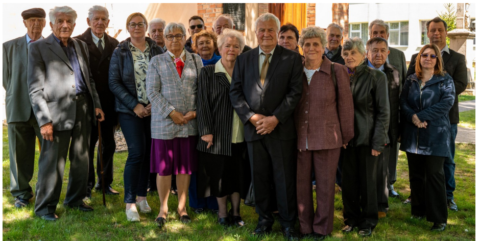
A Szent Vendel társulat tagjai

Idei terveink között szerepel, hogy felkeressük a Jászságban lévő Szent Vendel szobrokat, és a Jász Világtalálkózón szeretnénk képeken bemutatni a fellelhető többi szobrot is, hátha fel tudnánk hívni mások figyelmét is a hagyományok megőrzésére, tiszteletére.