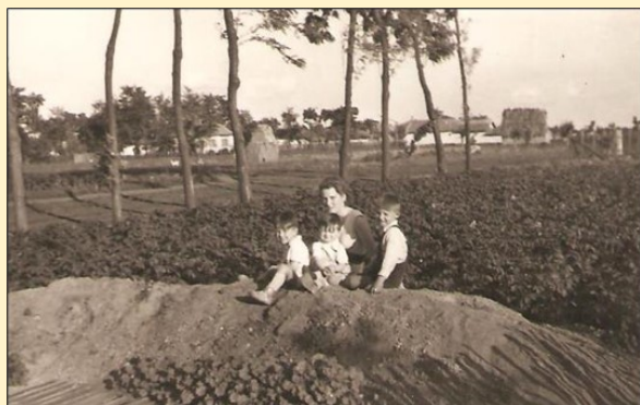
A Petőfi utca régen - és egy típusterv alapján készült ház az utcában