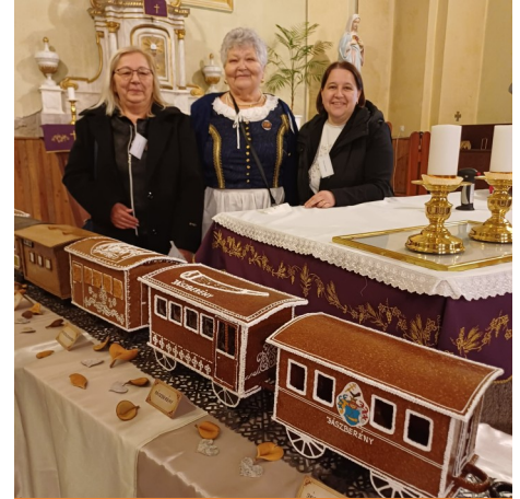
A rekorder grillázs vonat

Nekem már ez a második rekord kísérlet volt. 2005-ben Budapesten is ott voltam a 15 emeletes 3,63 méter magas torta készítésén. Mind a két rekord egy életre szóló élményt adott!